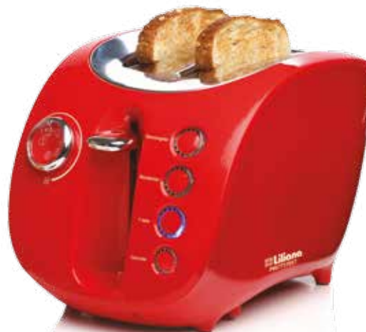
TOSTADORA ELÉCTRICA DE Dos BOCAS