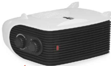
DOBLE POSICION DE USO HORIZONTAL Y VERTICAL