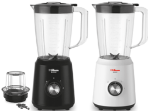
AL310 con Molinillo